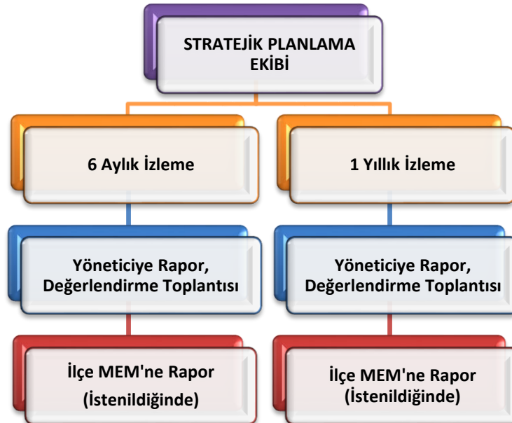
Şekil 8 Stratejik Plan İzleme ve Değerlendirme Modeli

Müdürlüğümüzün 2024-2028 Stratejik Planı İzleme ve Değerlendirme sürecini ifade eden İzleme ve Değerlendirme Modeli hazırlanmıştır. Okulumuzun Stratejik Plan İzleme-Değerlendirme çalışmaları eğitim-öğretim yılı çalışma takvimi de dikkate alınarak 6 aylık ve 1 yıllık sürelerde gerçekleştirilecektir. 6 aylık sürelerde Okul Müdürüne rapor hazırlanacak ve değerlendirme toplantısı düzenlenecektir. İzleme-değerlendirme raporu, istenildiğinde İlçe Milli Eğitim Müdürlüğüne gönderilecektir.